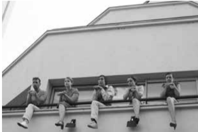
Là commence le ciel, Gratte-ciel de Villeurbanne, 2006

RZ D’autant qu’à Villeurbanne finalement il y avait deux publics : celui qui avait réservé sa place et qui suivait volontairement la représentation, et puis tous les autres, les habitants, les passants, qui voyaient des fragms de choses qu’ils n’identifiaient pas forcément à un spectacle ; ce qui n’arrive pas dans une salle.