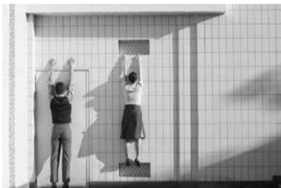
« OUI », Hôtel de ville, Le Blanc-Mesnil, 2004