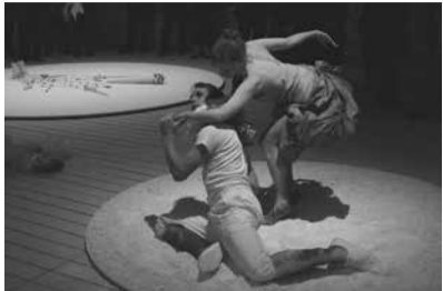
Les Trois Contents, Le Grand Hornu, Mons, Belgique, 2009