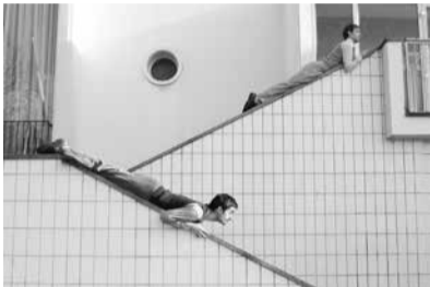
« OUI », Hôtel de ville, Le Blanc-Mesnil, 2004

Ou bien : après avoir attentivement observé les employés de mairie au travail, chacun isole quelques gestes de l’activité municipale, se les approprie pour être capable de les apprendre à un partenaire. On crée des duos qui enchaînent ces gestes en phrase dansée en faisant des choix de composition : répétitions, accélérations, suspensions, étirements du geste. Après quoi, on cherche à deux à inscrire cette phrase commune (pas forcément dansée à l’unisson bien sûr) dans les espaces du hall de la mairie : l’escalier, le perron intérieur, le bureau d’accueil, les bancs… On écrit donc un parcours à deux qui s’appuie sur les caractéristiques du lieu et dans lequel on déploie cette matière gestuelle puisée dans les comportements des employés. Quand je prépare mes répétitions, j’ai une idée en tête d’une scène, d’une action, et je cherche la proposition à faire aux danseurs qui pourrait les amener à cette action. Mais ce qui va se produire sur le « plateau » est toujours très différent de ce que j’avais imaginé. C’est cet écart qui m’intéresse et c’est à partir de cela que je vais écrire.