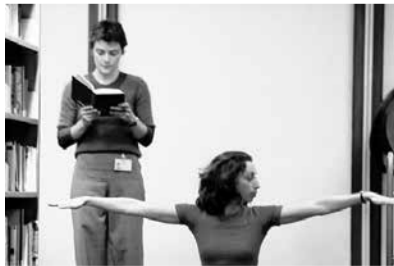
La danse en libre accès, Bibliothèque publique d'information, Centre Pompidou, 2004

JD J’ai d’ailleurs craint les débordements. Mais les interventions sauvages étaient assez justes : deux lecteurs poussaient leurs copines sur des chariots de livres tandis qu’elles y lisaient tranquillement le journal, deux jeunes filles s’allongeaient à répétition, leur corps s’inscrivant parfaitement dans les lés de maquette de couleurs.