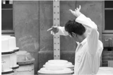
Les Trois Contents, Manufacture nationale de Sèvres, 2006

A la Manufacture de Sèvres également, pour des raisons très différentes, j’ai préféré faire un film. Le lieu renferme des pièces précieuses, les espaces sont trop exigus, j’ai demandé à Arnold Pasquier de filmer notre travail là-bas.