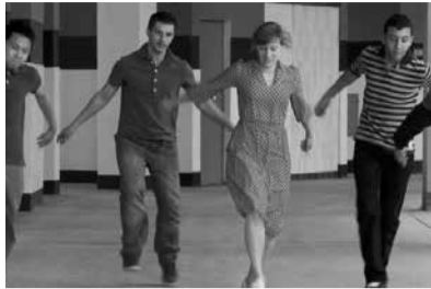
Après un rêve, La Villeneuve, Grenoble, 2012

de Grenoble, parce que je ne pouvais pas faire venir des spectateurs physiquement dans ce lieu, le contexte politique ne s’y prêtait pas, le quartier traversait une crise grave, ç’aurait été indécent.