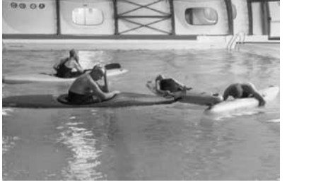
L'Architecte de Saint-Gaudens, 2014

MP On pourrait donc ne plus parler de film. C’est une pièce de danse.